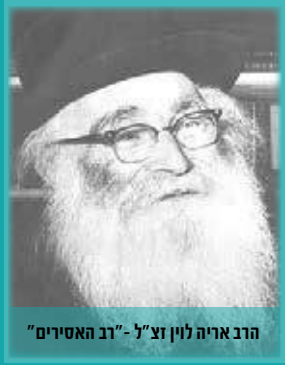
הרב אריה לין זצ"ל - "רב האסירים"