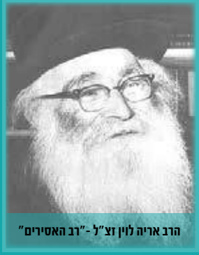
הרב אריה לנין זצ"ל - "רב האסירים"