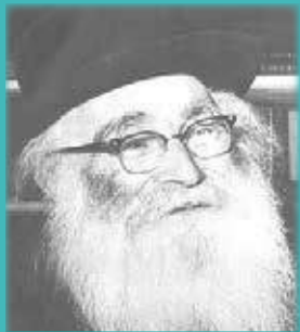
הרב אריה לין זצ"ל - "רב האסירים"