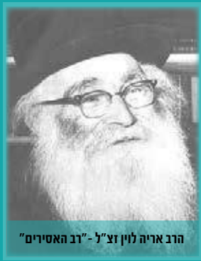
הרב אריה לין זצ"ל - "רב האסירים"